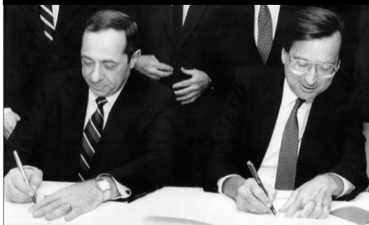
Mario Cuomo, Governor of New York and Robert Bourassa, Premier of Québec, 1988