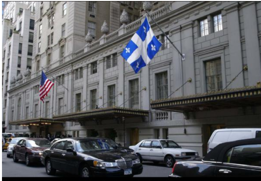
Québec Premier Jean Charest's first official visit to New York, 2003