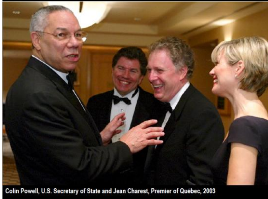
Colin Powell, U.S. Secretary of State and Jean Charest, Premier of Québec, 2003