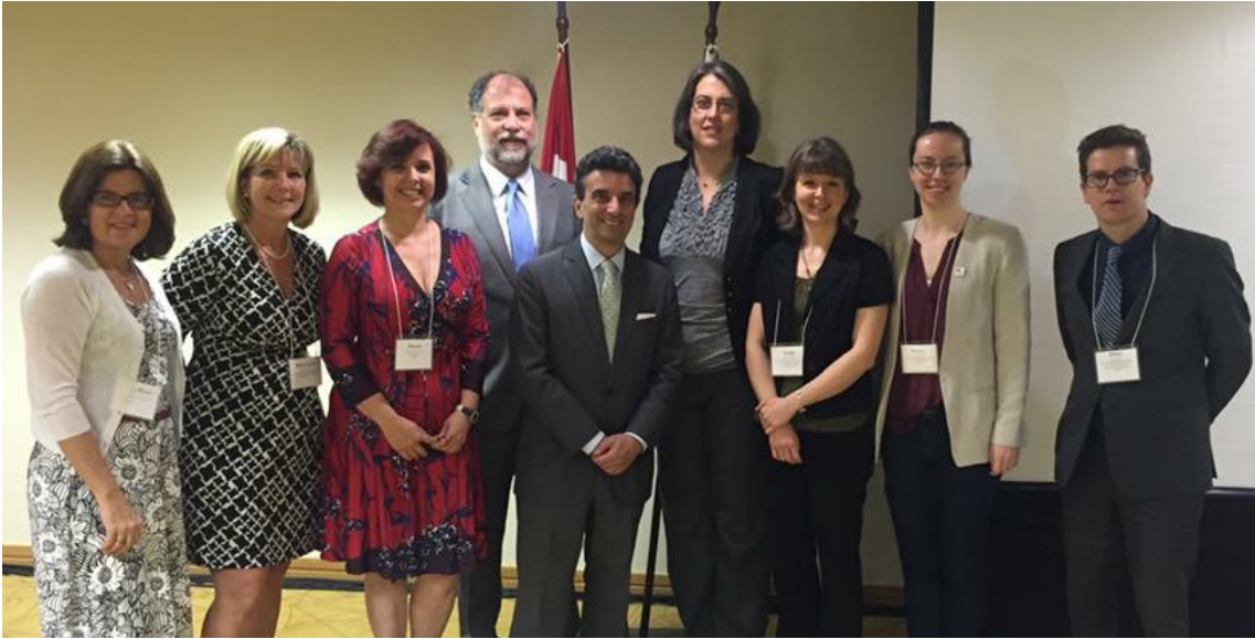
Representantes dos parceiros organizadores (Universities Canada, Languages Canada, Colleges and Institutes Canada, Associação Brasileira de Educação Internacional (FAUBAI) e o programa Idiomas sem Fronteiras do Ministério da Educação do Governo do Brasil com o Consul Geral do Canadá em São Paulo Stéphane LaRue

Universities Canada, Languages Canada, Colleges and Institutes Canada, a Associação Brasileira de Educação Internacional (FAUBAI) e o programa Idiomas Sem Fronteiras do Ministério da Educação do Governo do Brasil, co-organizaram o Segundo Fórum Canadá-Brasil de Idiomas, Educação e Mão de Obra em São Paulo, Brasil, nos dias 21 e 22 de março. O evento foi apoiado pela Embaixada do Canadá em Brasília, pelo Consulado Geral do Canadá em São Paulo e pelo programa Oportunidades Globais para Associações do Governo do Canadá.