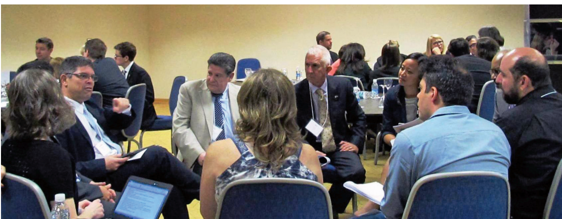
Pequenos grupos de discussão